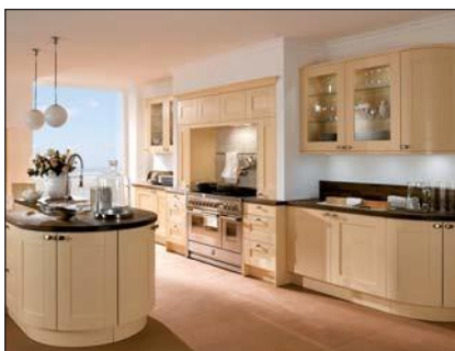
Plaqué lustre laqué (6035)

Pour les façades à bois plaqué, le décor du bois peut être décalé au sein de la façade du meuble. Des réclamations concernant un décalage dans le décor du bois et de la structure ne sont pas justifiées.