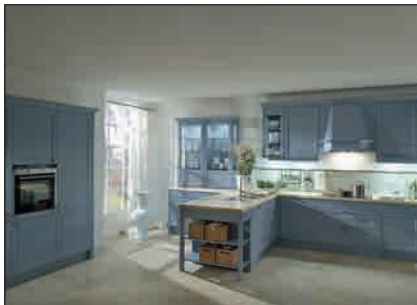
Frêne laqué (Bristol)

Le support est un panneau MDF revêtu par un papier d'apprêt préparé pour être peint. Les chants sont lissés selon un procédé spécifique et scellés. Les façades sont vernies avec une laque mate.