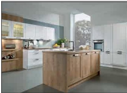
Enveloppée d'un polymère (Lotus, Breda, Texel, Solaris, Castell)