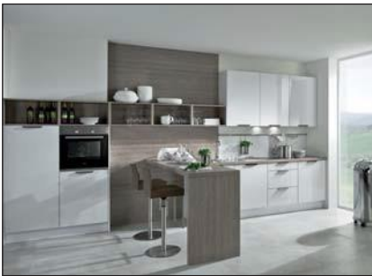
Lustre laqué (Cristall)

Des plaques de fibre (MDF) de différentes épaisseurs avec un revêtement unilatéral (un papier d'apprêt préparé pour être peint) à base de résine de mélamine (les papiers de décor imprégnés de résine de mélamine sont pressés directement lors de la fabrication avec le panneau porteur) servent de porteur pour les façades lustres. La surface et les chants sont lissés et scellés selon un procédé spécial. Après cette préparation, les façades reçoivent plusieurs couches de laque polyester pour obtenir une surface absolument lisse. Pour terminer, une couche de laque polyuréthane lustre est appliquée lors d'une dernière étape de travail.