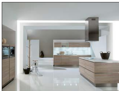
Méla miné (1080, 1030, 1090, 1095, 1092, 2080)