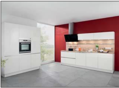
Laminé laqué (Laser Soft, Laser Brillant)

Pour les façades à reproduction, le décor du bois peut être décalé au sein de la façade du meuble. Des réclamations concernant un décalage dans le décor du bois et de la structure ne sont pas justifiées.