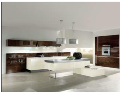
Plaqué lustre laqué (6080)

Pour les façades à bois plaqué, le décor du bois peut être décalé au sein de la façade du meuble. Des réclamations concernant un décalage dans le décor du bois et de la structure ne sont pas justifiées.