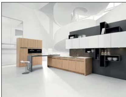
Plaqué (5080, 5081, 5082, 5083, 6021/6020)

Le support est un panneau MDF revêtu d'un film thermoplastique préparé pour être peint. La face arrière est revêtue d'un papier d'apprêt préparé pour être peint. Les façades sont vernies de tous les côtés avec une laque mate. Les laques mates contribuent à la protection de l'environnement. Elles sont écophiles, car étant hydrosolubles, elles contiennent à peine de solvants et sont bien entendu exemptes d'aldéhyde formique. Sous l'action des rayons ultraviolets, ces laques très performantes sont extrêmement résistantes et répondent aux exigences chimiques et mécaniques les plus sévères. La laque est caractérisée par son élégance et sa résistance à la lumière.