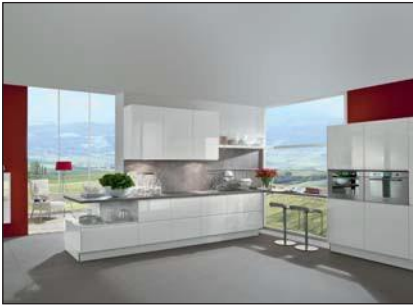
Lustre laqué (Faro, Lumos)

Le laminé laqué se caractérise par son esthétique, sa qualité et sa finition. Le support est un panneau MDF qui est recouvert sur l'avant d'un laminé polymère. La surface est recouverte en plus d'une laque. Ainsi on obtient une grande homogénéité au niveau de la surface, une grande résistance aux griffures et un haut niveau de brillance ou d'effet mat. Le recouvrement des chants est exécuté sur tous les côtés avec un chant épais légèrement arrondi.