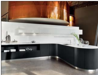
Laque mate (6000)

Le matériau support est un panneau MDF de 19mm d'épaisseur recouvert directement d'une pellicule (Mélamine). La face frontale est ensuite recouverte d'une couche de laque mate (laque écophile résistante aux UV). Le recouvrement des chants est exécuté sur tous les côtés avec un chant épais légèrement arrondi.