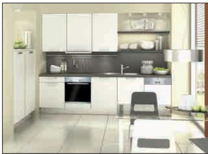
Laque mate (Avus)

Pour les façades à reproduction, le décor du bois peut être décalé au sein de la façade du meuble. Des réclamations concernant un décalage dans le décor du bois et de la structure ne sont pas justifiées.