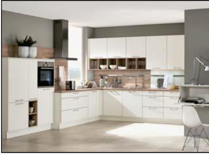
Méliné (Atlanta, Bali, Boston, Comet, Montana, Neo, Uno)