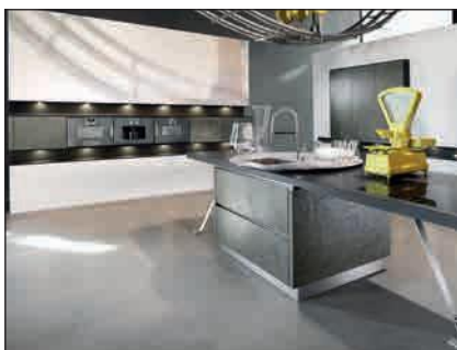
Verre plaquée (7030)

Le panneau porteur fait 16mm d'épaisseur et est collé sur l'arrière coloré d'une planche en verre de sécurité, 3mm d'épaisseur.