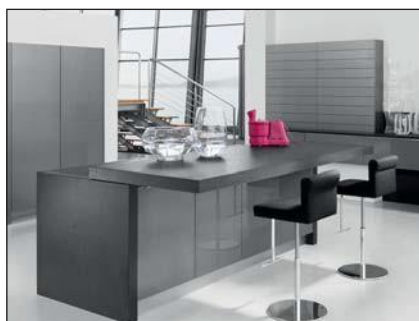
Lustre laqué (4030, 5025)

Des panneaux de fibres (MDF) avec un revêtement décoratif unilatéral à base de résine de méla mine servent de supports pour toutes les façades enveloppées. Le revêtement s'effectue en utilisant des colles pauvres en polluants et sans solvant. Des feuilles thermoplastiques sont utilisées (PVC).