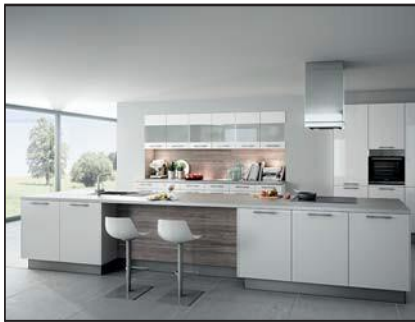
Laque mate (2035)