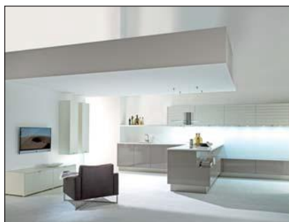
Lustre laqué (2030)

Le matériau support est une plaque MDF revêtue sur la face arrière de résine de méla mine en utilisant un papier de coloris adapté. La surface de la face avant est au préalable enduite d'une couche de fond acrylique. Les chants et la surface reçoivent ensuite 3 couches de laque polyester. Au cours des deux étapes suivantes on applique une couche de laque PUR blanc mat et une couche de laque PUR brillante dans le coloris de façade correspondant.