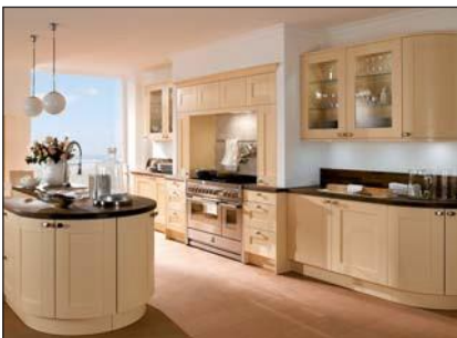
Enveloppée d'un polymère (Oxford)

Le support est un panneau MDF, recouvert des deux côtés par un revêtement à base de résine de mélamine. La face frontale est recouverte ensuite d'une seule couche de laque brillante de couleur (laque écophile résistante aux UV). Le recouvrement des chants est exécuté sur tous les côtés avec chant épais légèrement arrondi avec optique verre.