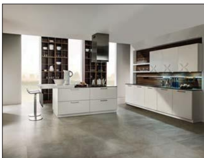
Laque mate (5007/5020/5035)

Le support est un panneau MDF revêtu par un papier d'apprêt préparé pour être peint. Les chants sont lissés selon un procédé spécifique et scellés. Les façades sont vernies avec une laque mate. Les laques mates contribuent à la protection de l'environnement. Elles sont écophiles, car étant hydrosolubles, elles contiennent à peine de solvants et sont bien entendu exemptes d'aldéhyde formique. Sous l'action des rayons ultraviolets, ces laques très performantes sont extrêmement résistantes et répondent aux exigences chimiques et mécaniques les plus sévères. La laque est caractérisée par son élégance et sa résistance à la lumière.