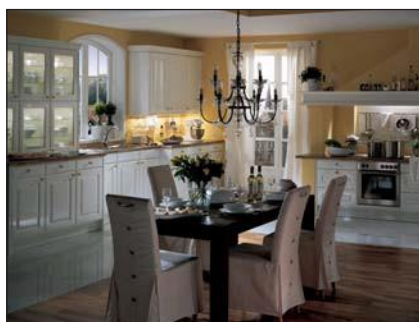
Lustre laqué (5030)

Des plaques de fibre (MDF) de différentes épaisseurs avec un revêtement unilatéral (un papier d'apprêt préparé pour être peint) à base de résine de méla mine (les papiers de décor imprégnés de résine de méla mine sont pressés directement lors de la fabrication avec le panneau porteur) servent de porteur pour les façades lustres. La surface et les chants sont lissés et scellés selon un procédé spécial. Après cette préparation, les façades reçoivent plusieurs couches de laque polyester pour obtenir une surface absolument lisse. Pour terminer, une couche de laque polyuréthane lustre est appliquée lors d'une dernière étape de travail.