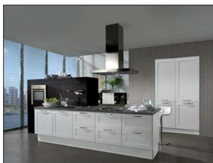
Envelopée d'un polymère (3030)

à base de résines pouvant être durcies. Examens et jugements selon DIN EN 438. Composée de papiers de décor imprégné de résine méla miné. Une ou plusieurs couches. Les stratifiés sont collés sur un panneau de qualité en matériaux dérivés du bois. Selon la demande, le côté du décor est muni de résine méla miné à overlay imprégné.