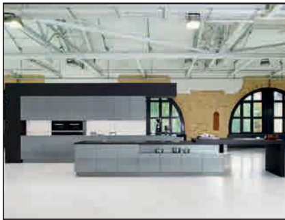
Façades de verre design (5090, 5095)